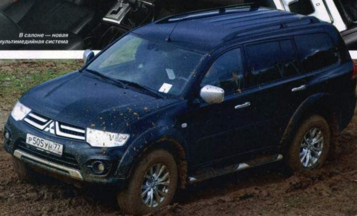
Даже на шоссейной резине автомобиль отлично показал себя на бездорожье