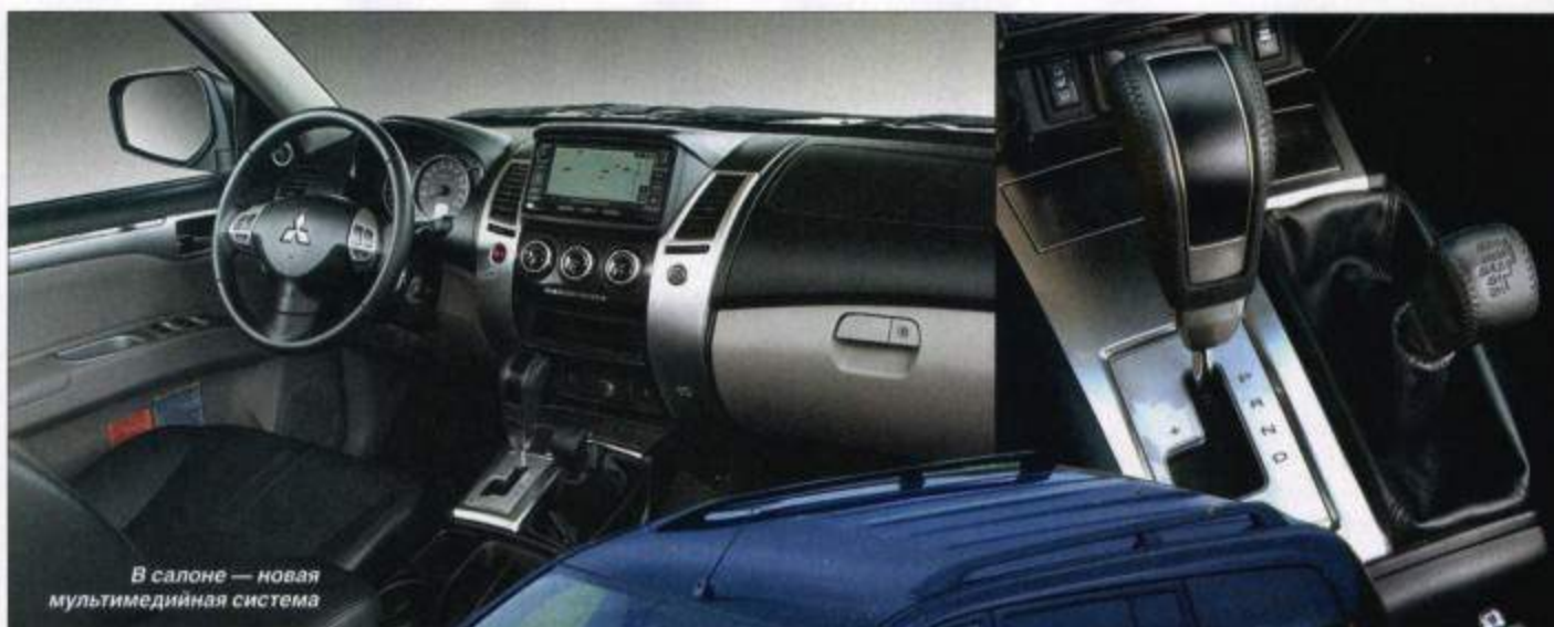
В салоне — новая мультимедийная система